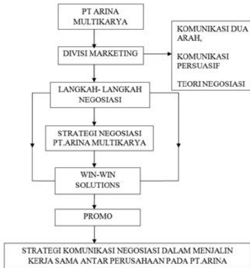
Kerangka Pemikiran Proses Negosiasi Hingga Terjalinya Kerjasama

Kerangka pemikiran merupakan penerapan kerangka konsep berdasarkan kerangka teori yang telah dipilih untuk mendekati/memahami masalah atau fenomena yang diteliti. Kerangka pemikiran ditutup dengan